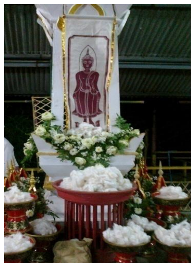
“ซุ้มทำบุญซื้อดอกฝ้าย” เตรียมไว้ให้ผู้มาชมงานได้ร่วมทำบุญซื้อดอกฝ้ายเพื่อนำไปทอผ้า