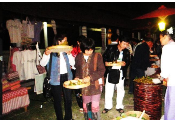
ผู้ร่วมงานเดินเลือกชิมอาหารพื้นบ้าน