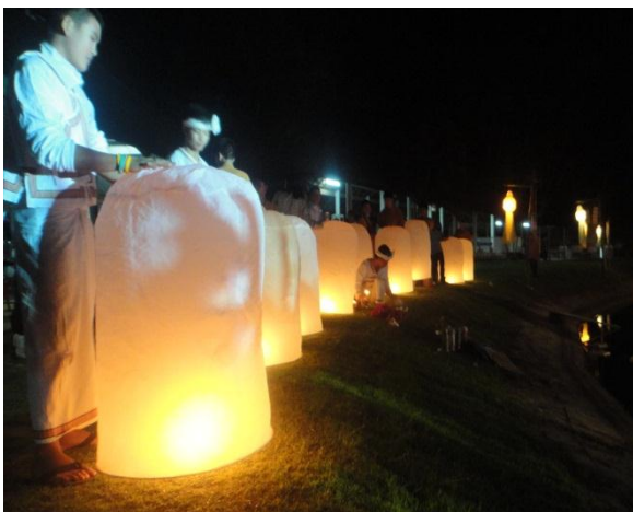
ผู้ร่วมงานปล่อยโคมไฟ