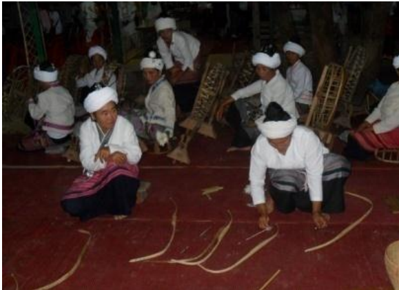
เตรียมอุปกรณ์ในการตีฝ้าย