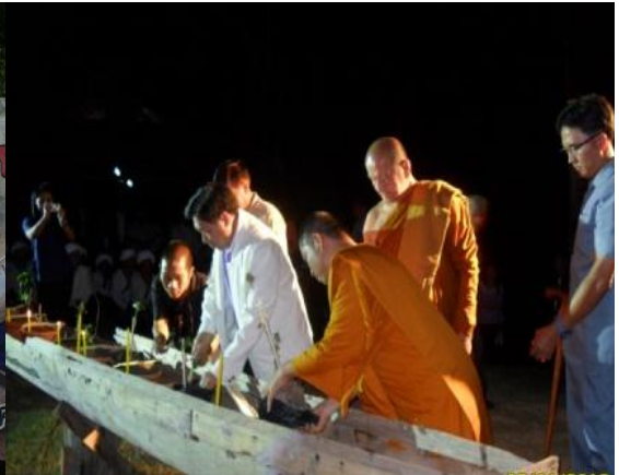
ประธานในพิธีกำลังปลุกฝ้าย