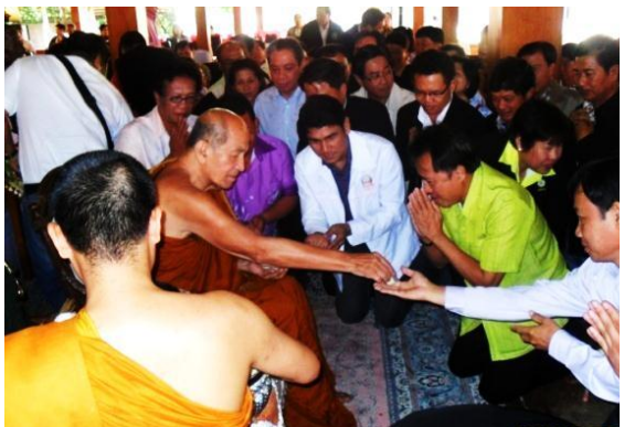
พระเทพวิสุทธิญาณ เจ้าอาวาสวัดอนาลโยทิพ ยาราม มอบวัตถุมงคลให้แก่ผู้เข้าร่วมพิธี