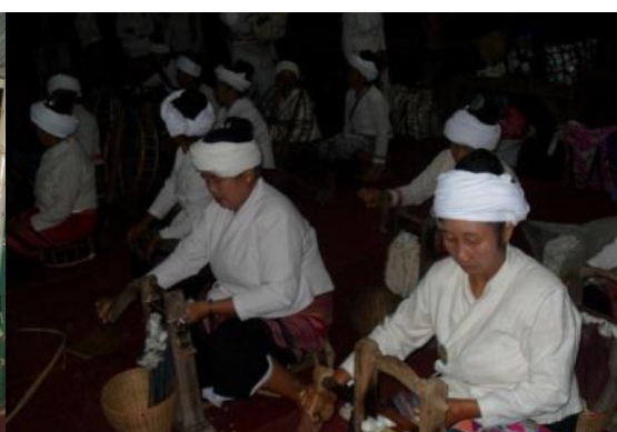
ชาวบ้าน “อีดฝ้าย” แยกเมล็ดออกจากดอกฝ้าย