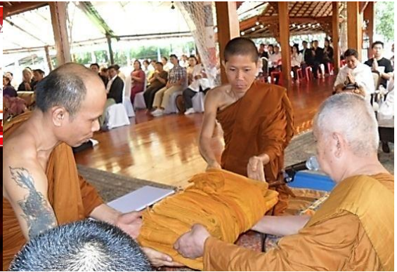
พระคู่สวดผู้ตัดกำลังมอบผ้าจุลกฐิน ให้พระผู้ที่จะถือครองผ้าจุลกฐิน