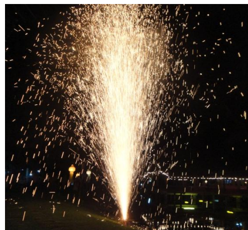
พลุดอกไม้ไฟช่วยสร้างบรรยากาศงานบุญ