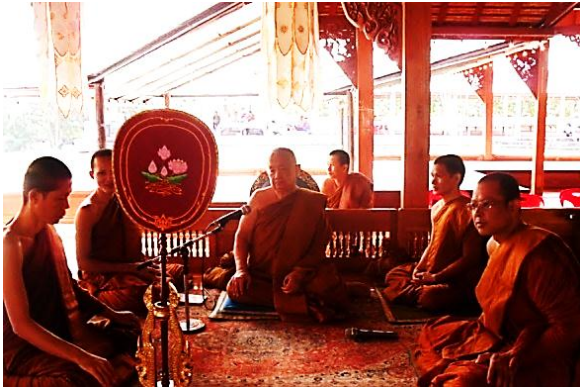
พระสงฆ์เตรียมพร้อมที่จะสวดอุปปโลกน์