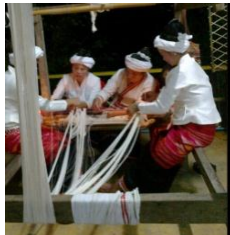
เตรียมเส้นฝ้ายขึ้นที่ทอผ้า