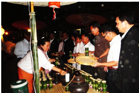
ชุมนุมเครื่องดื่มในภาคหม้า