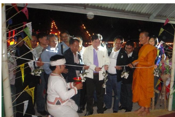
ประธานในพิธีเปิดช่วงทอผ้า