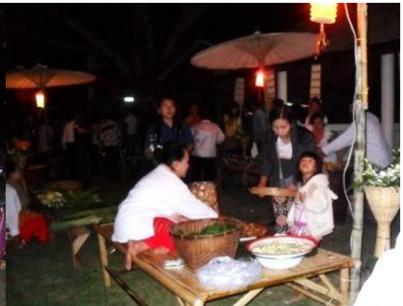
ชุมนุมอาหารในภาคหม้า