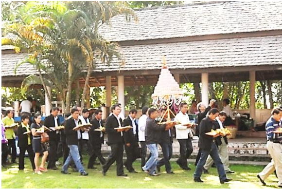
คณะเจ้าภาพเข้าร่วมขบวนแห่