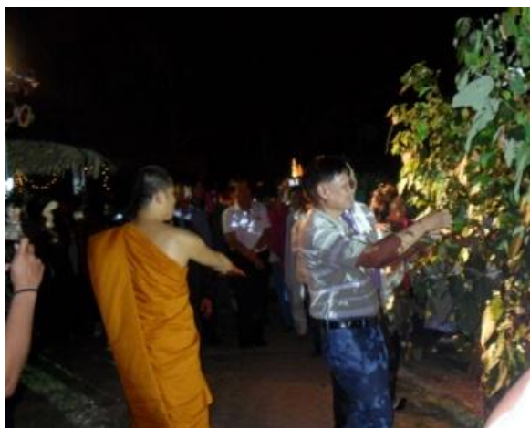
ประธานในพิธีกำลังเก็บดอกฝ้าย