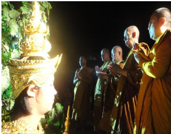
พระสงฆ์เจริญชัยมงคลคาถา