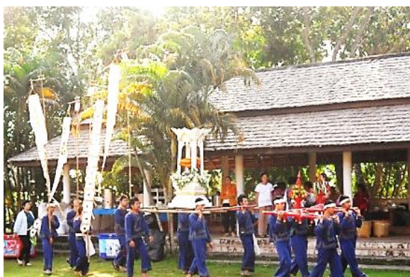
ขบวนพิธีแห่ผ้าจุลกฐิน