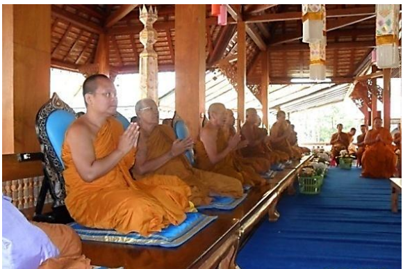
พระสงฆ์รับเครื่องไทยทานแล้ว ก่อนโมทนาผ้าจุลกฐิน