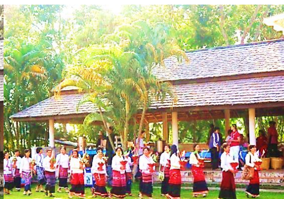
ขบวนแห่ผ้าจุลกฐิน