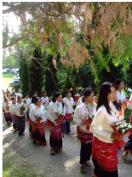
ชาวบ้านเข้าร่วมพิธีแห่ผ้าจุลกฐิน