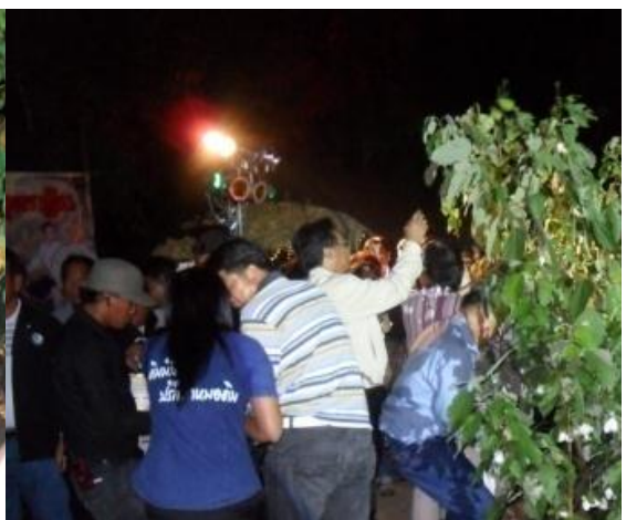
คณะผู้เข้าร่วมพิธีต่างก็ช่วยกันเก็บดอกฝ้าย