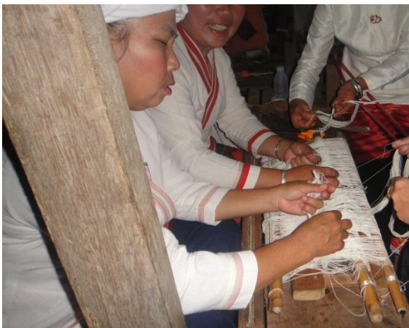
ต่อเส้นฝ้ายเพื่อเตรียมทอผ้า