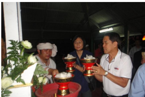
ผู้มาร่วมงานบูชาซื้อดอกฝ้าย