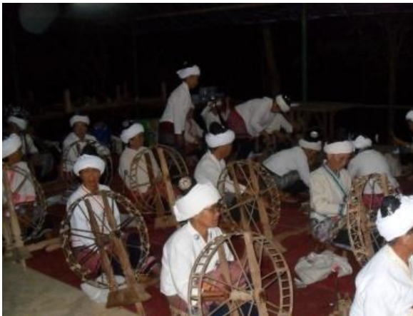
ชาวบ้านปั่นฝ้าย