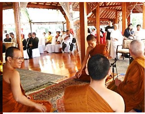
พระสงฆ์ที่จะทำพิธีอุปโลกน์จุลกฐิน