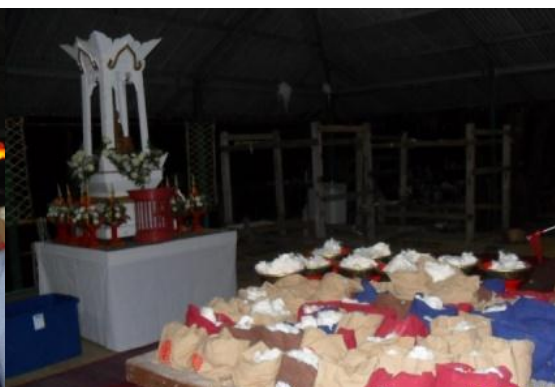
ผู้ร่วมทำบุญจะได้รับข้อมฝ้ายเป็นของที่ระลึก