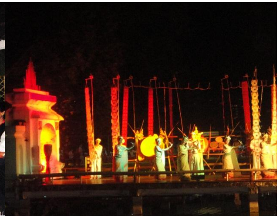
การแสดงพื้นบ้านล้านนา