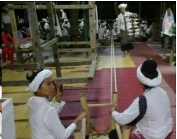
เตรียมเส้นฝ้ายเพื่อปั่นเข้ากระสวย