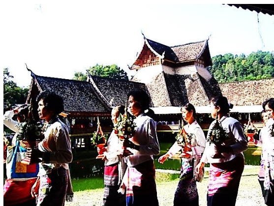
แห่ขบวนผ้าจุลกฐินรอบวิหารจัตุรมุข