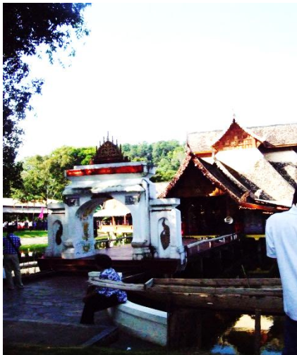
วิหารจัตุรมุข สถานที่ประกอบพิธี