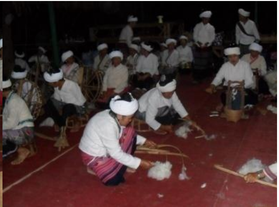
ตีฝ้ายให้ขึ้นฟู