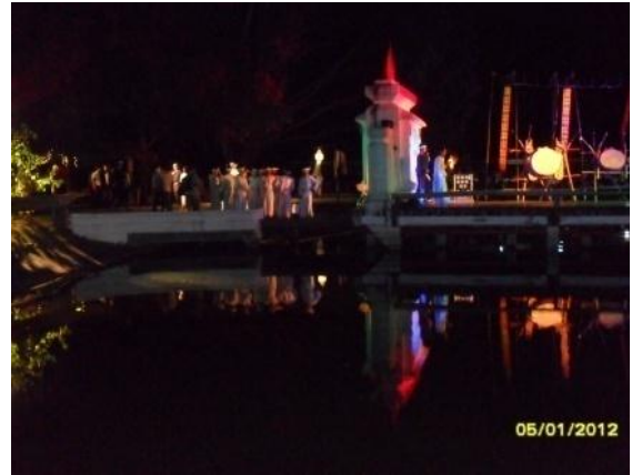
บริเวณเวทีกลางน้ำ