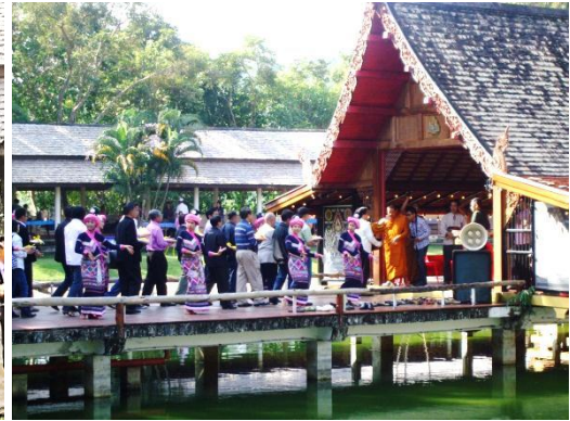
ขบวนแห่จุลกฐินเข้าสู่สถานที่ประกอบพิธี