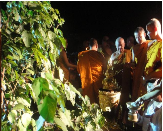
เริ่มพิธีเก็บดอกฝ้าย