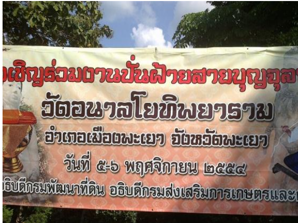
ป้ายกำหนดการงานป๋นฝ้ายสายใยบุญจุกฐิน