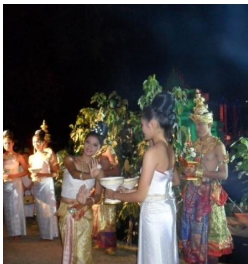
การแสดงประกอบขณะเก็บดอกฝ้าย