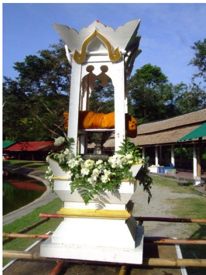
ผ้าจุลกฐินที่เตรียมแห่ขบวนในตอนเช้า