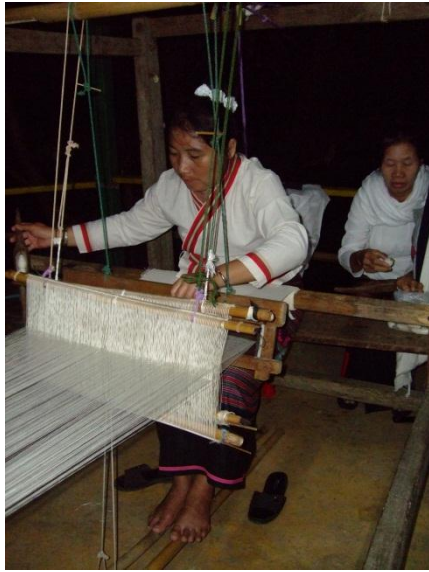
ช่างชาวบ้านช่วยกันทอผ้า