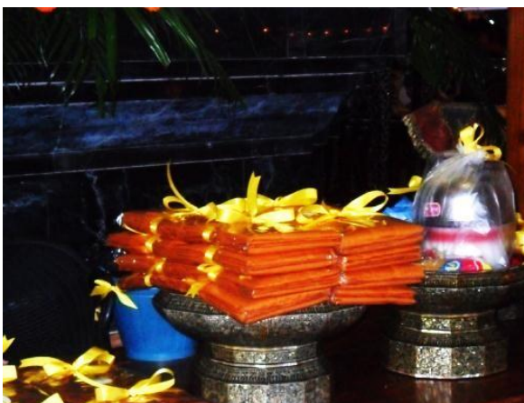
เครื่องอัฐบริขารและบริวารกฐิน