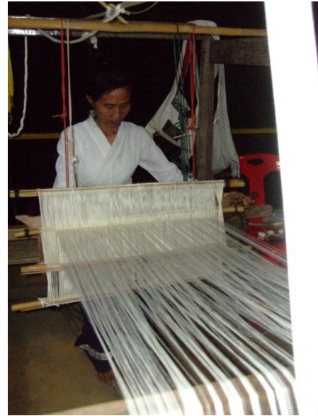
ช่างชาวบ้านช่วยกันทอผ้า