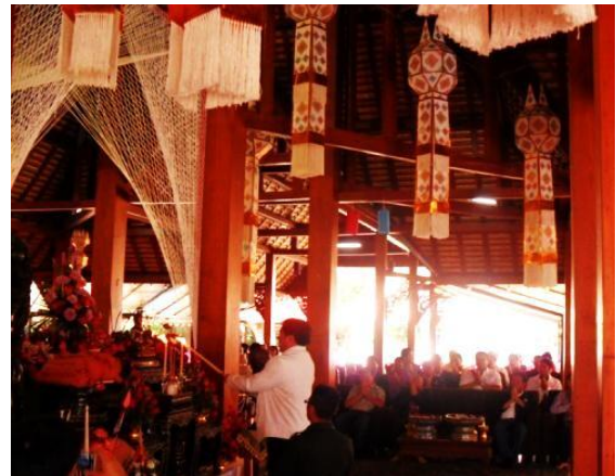
อริบตีกรมพัฒนาที่ดิน อริบตีกรมส่งเสริม การเกษตรและคณะ เป็นเจ้าภาพทอด ผ้าจุลกฐิน ณ วัดอนาลโย