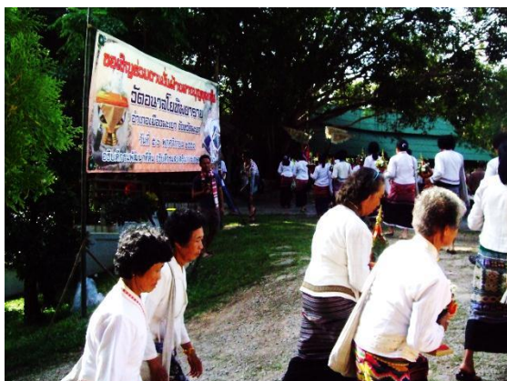
ชาวบ้านเข้าร่วมขบวนแห่จุลกฐิน