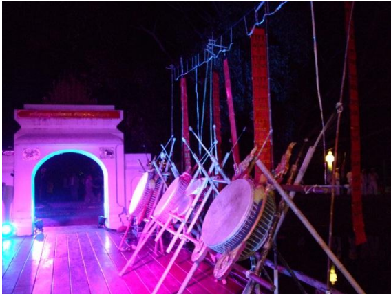
ลานแสดงศิลปวัฒนธรรมล้านนา