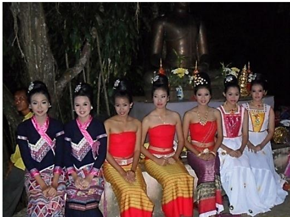
นักแสดงแต่งกายแบบพื้นบ้านล้านนา