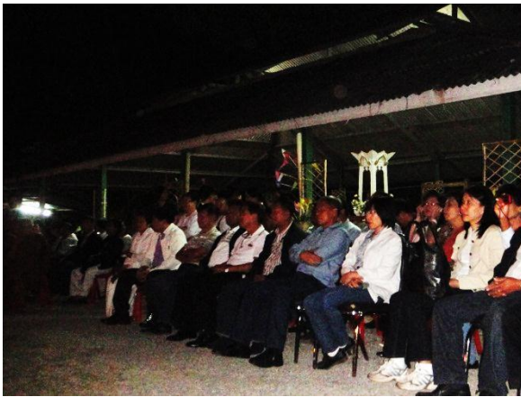
ร่วมชมการแสดง