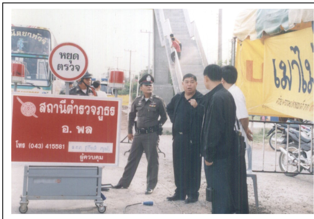
ภาพที่ ๔. เจ้าหน้าที่ตำรวจของ สถานีตำรวจภูธรอำเภอพล ปฏิบัติงานในโครงการ “แม่ใจขับ”