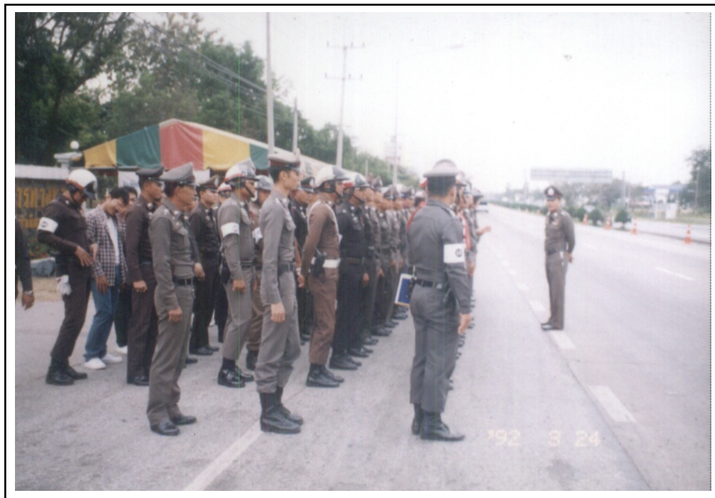
ภาพที่ ๓. เจ้าหน้าที่ตำรวจจัดแถวออกปฏิบัติเพื่อป้องกันลดอุบัติเหตุในเทศกาลต่างๆ