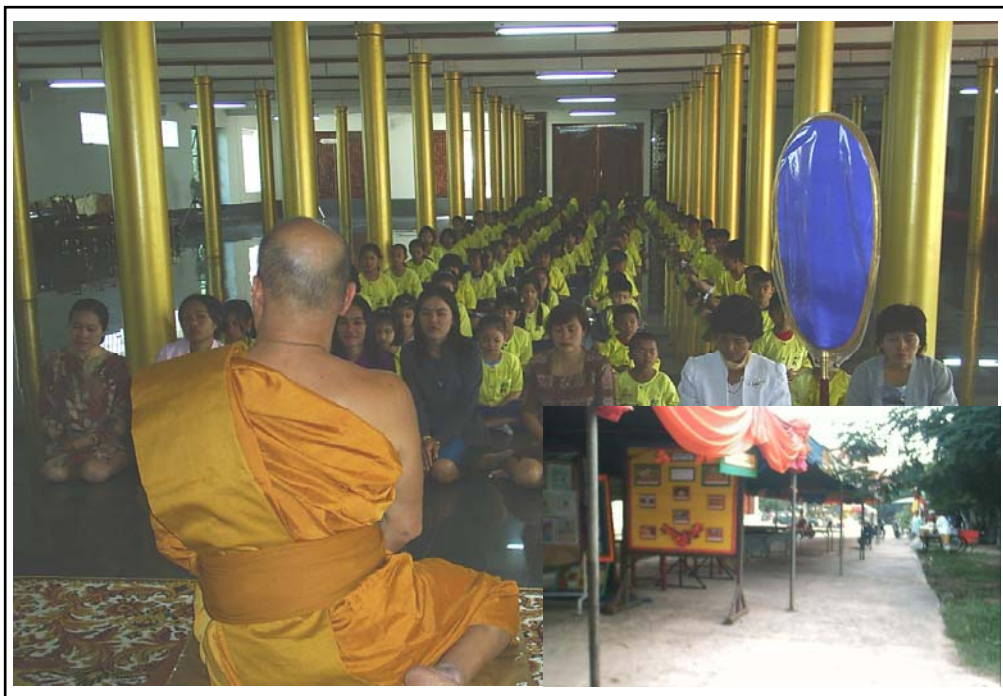
ภาพที่ ๒. พระสงฆ์ในเขตเทศบาลอำเภอพลจัดนิทรรศการ งดเหล้าเข้าพรรษา ๑๒ กรกฎาคม ๒๕๕๘ และอบรมเยาวชนจากสถานการศึกษาต่างๆ ในวันสำคัญทางพระพุทธศาสนา