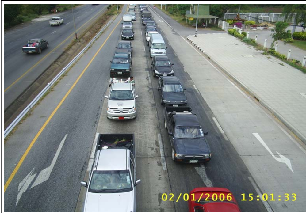
ภาพที่ ๗. สภาพความคับคั่งของรถที่ผ่านไป-มา ในเขตเทศบาลเมืองเมืองพล