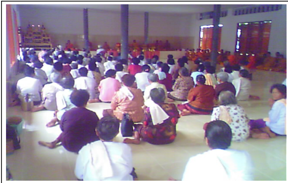
ภาพที่ ๑. พระสงฆ์ในเขตเทศบาลเมืองเมืองพล อบรมประชาชนเรื่องความประมาท ๑ กรกฎาคม ๒๕๕๘