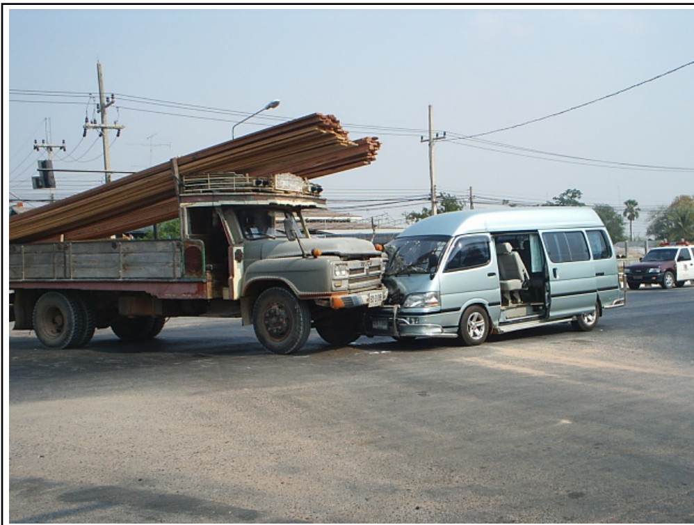
ภาพที่ ๘. ตัวอย่างเหตุการณ์ของอุบัติเหตุภายในเขตเทศบาลเมืองเมืองพล