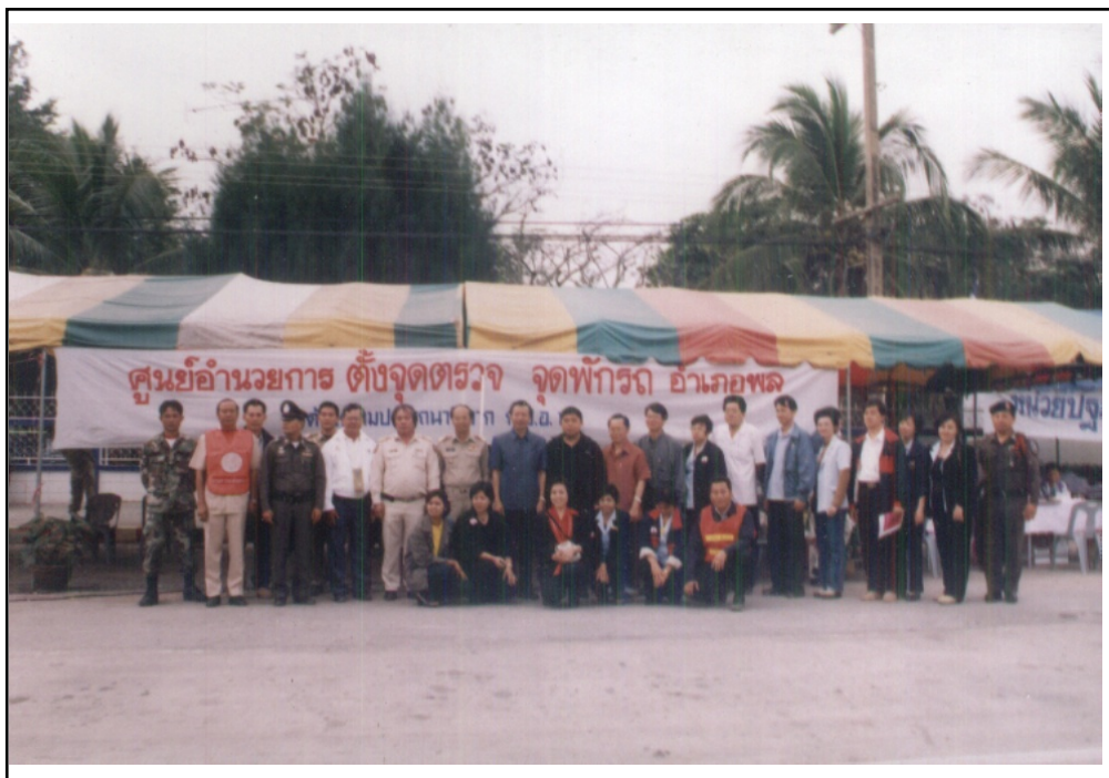
ภาพที่ ๖. เจ้าหน้าที่ตำรวจและพยาบาลในเขตเทศบาลออกปฏิบัติเพื่อป้องกันลดอุบัติเหตุในเทศกาลต่างๆ