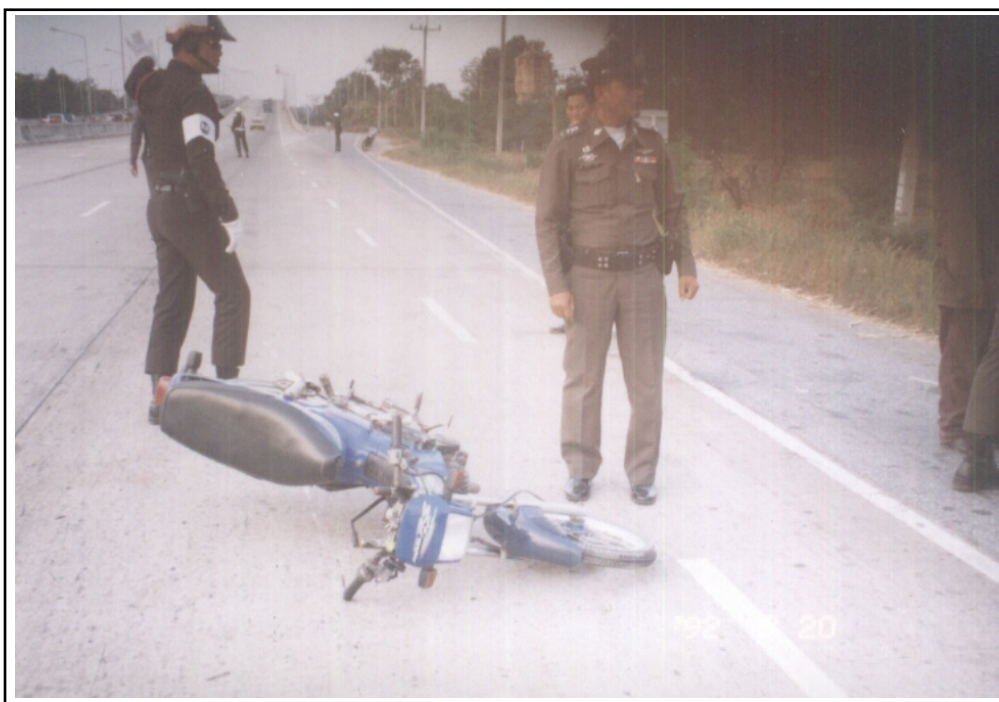
ภาพที่ ๑๐. ตัวอย่างเหตุการณ์ของอุบัติเหตุภายในเขตเทศบาลเมืองเมืองพล