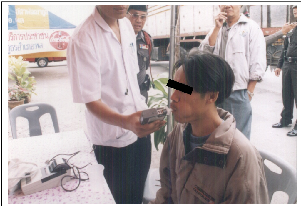
ภาพที่ ๕. เจ้าหน้าที่พยาบาลกำลังตรวจแอลกอฮอล์ของผู้ขับขี่ในโครงการ “เมาไม่ขับ”