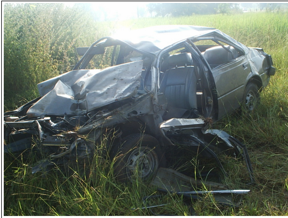
ภาพที่ ๙. ตัวอย่างเหตุการณ์ของอุบัติเหตุภายในเขตเทศบาลเมืองเมืองพล