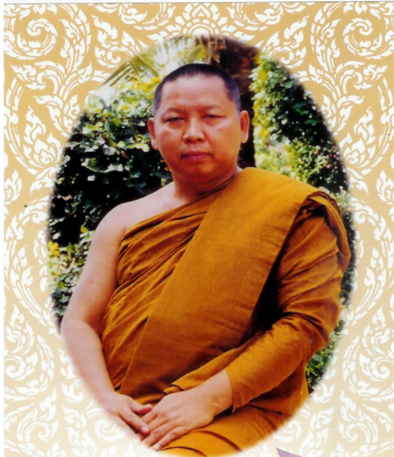
พระเทพวรคุณ (สมาน สุเมโธ ป.ธ.๕) เจ้าคณะภาค ๕ (ธรรมยุต) เจ้าอาวาสวัดป่าแสงอรุณ ตำบลพระลับ อำเภอเมือง จังหวัดขอนแก่น