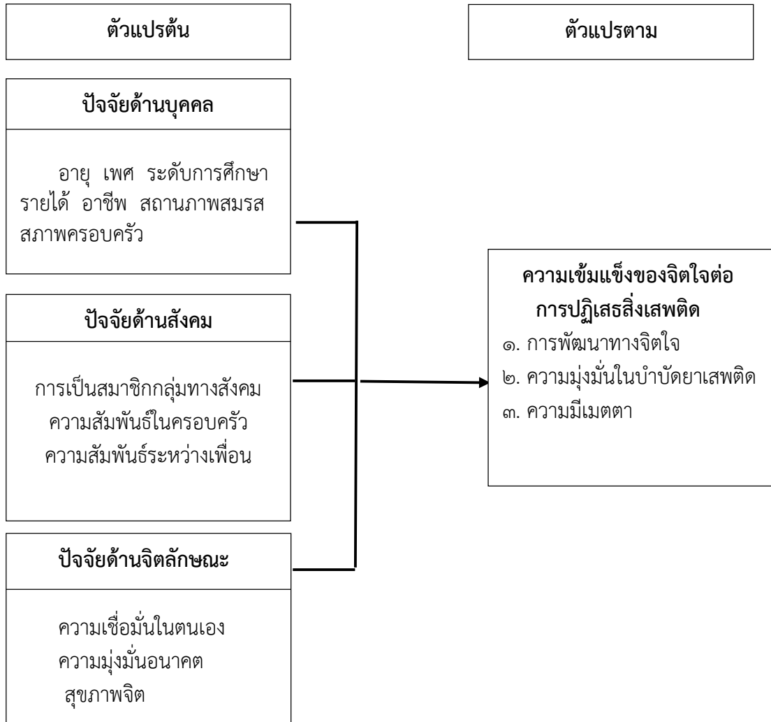
ภาพที่ ๒.๑ “ปัจจัยทางพุทธธรรมที่ส่งผลต่อความเข้มแข็งของจิตใจเพื่อการฟื้นฟูผู้ติดยาเสพติด”